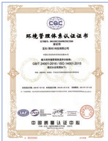
亞東常州環境管理體系認證證書

本集團嚴格遵守《中華人民共和國環境保護法》、《中華人民共和國環境保護稅法》等國家和地方的法律法規，持續建立健全環保工作標準與制度，將綠色發展理念貫穿整個生產運營過程中。亞東常州制定並完善了《環境保護管理制度》，明確了不同部門以及各層級負責人員的工作職責，進一步細化環境保護重點工作，提升排放物及能耗管理的能力與表現，致力於不斷降低運營及辦公活動對環境的影響。亞東常州參照《排污單位自行監測技術指南總則》HJ 819-2017制定了污染源監測方案，對生產過程中所產生的廢氣、廢水排放設置監測點，嚴格執行監測方案並確保監測質量。同時，本集團建立並維持了符合環境管理體系認證證書(GB/T 24001-2016以及ISO 14001:2015)標準認證的環境管理體系，入選國家級綠色工廠名單。