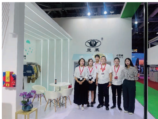
上海秋冬面料展會

本集團格外重視產品和技術的研發創新。為了打造產品的特色，拓展產品的業務範圍和領域，亞東常州在多纖維混紡面料的開發上不斷突破瓶頸。本報告期內，在紡織產品激勵的競爭下，亞東常州依然取得了483個樣品種類，以及1,691色色位，可肯測試進行了1,562塊樣品，均創下了本集團的歷史新高。本年度，亞東常州優秀的創新產品獲得了市場與行業的認可，曾受邀參加上海秋冬面料展會。