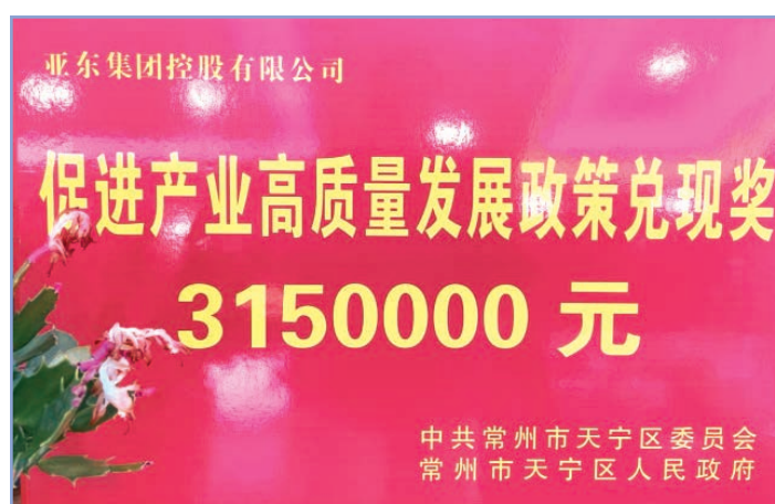
榮獲促進產業高質量發展政策兌現獎

亞東常州制定了銷售退回管理制度，公司的銷售退回須經銷售部長、分管副總審批後進行。在確認接收客戶提出的退貨要求時，經辦業務員需要填寫「質量處理報告」，質檢部對退回的貨物進行質量檢查並在「質量處理報告」上填寫質檢部意見，倉庫保管員清點退回貨物數量並開具「退貨返修單」後交由財務部登記，財務部應當對「質量處理報告」「質量處理報告」和退貨方出具的退貨憑證等進行審核後辦理相應的賬務處理。而後公司對退貨原因進行分析後明確有關部門人員的責任。本報告期，未發生因產品健康與安全原因發生的召回事件。