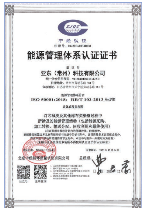
亞東常州能源管理體系認證證書

在蒸汽和天然氣管理方面，本集團規定對重點用能設備必須安裝計量裝置，每月按慣例檢查裝置是否正常運轉，保證計量的時效性與準確性。同時，做好蒸汽管線和燃氣管道的日常維護和檢修工作，盡可能的減少不必要的蒸汽熱量損失，排查任何潛在的燃氣安全隱患。