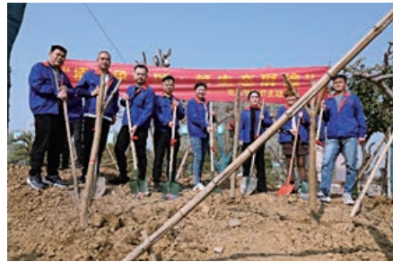
組織員工舉辦植樹節主題活動