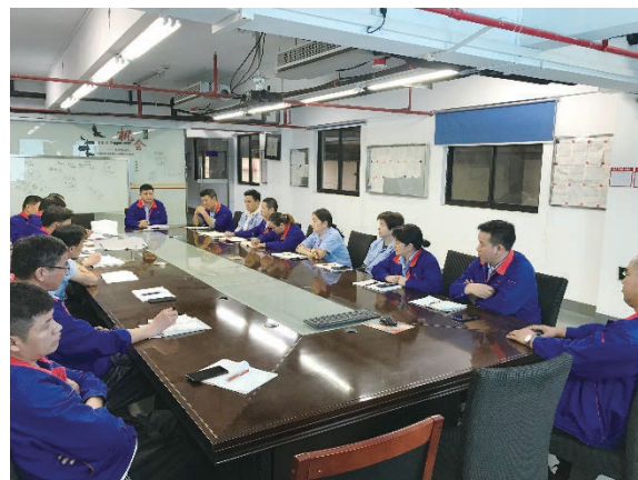
亞東常州開展職業培訓活動