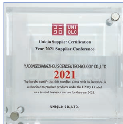
優衣庫頒發的合格供應商認證

本集團格外重視對消費資料和隱私的保護，亞東常州在《員工管理制度》中明確規定員工必須對公司和客戶所提供的機密數據保密，嚴格禁止任何員工利用或向他人傳播機密數據，並且在必要時要求員工、主管和董事均簽署保密協議以確認他們同意不泄露機密資料。