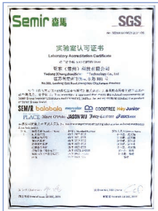
森馬實驗室認可證書

本報告期，亞東常州在紡織品耐光色牢度、耐皂洗色牢度、耐水色牢度以及接縫滑移等方面的檢查中都表現優異，從而獲得了合作服裝製造商實驗室的認可證書等榮譽。除此之外，亞東常州依然於本報告期內對客戶滿意度進行了調查，從質量、價格、交貨、服務四個維度了解客戶對公司的滿意程度及意見與建議，共計10家企業參加了調查，最終滿意度得分為97分/100分。