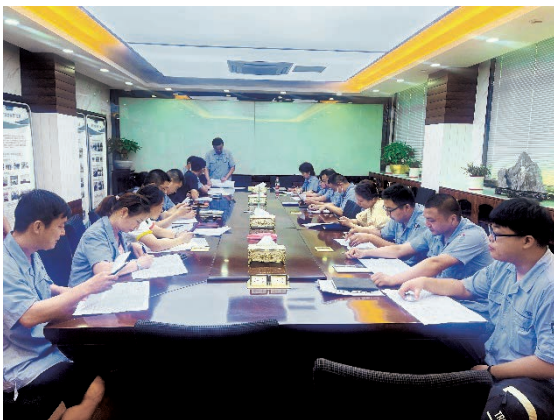
業務員內部學習培訓

為進一步提高未來的生產效率與產品質量，亞東常州將加強技術崗位及業務人員培訓，提高各項測試技能，增加檢測設備和測試項目，穩定測試手法，提高各項數據的準確性，加快判定產品合格速度。同時，加強整體部門人員管理，每季度進行一次技術以及相關業務技能知識的培訓。加強現場管理，減少人為差錯，保持現場整潔，規範，提高整體綜合水平。