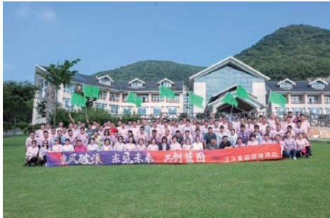
開展戶外拓展訓練