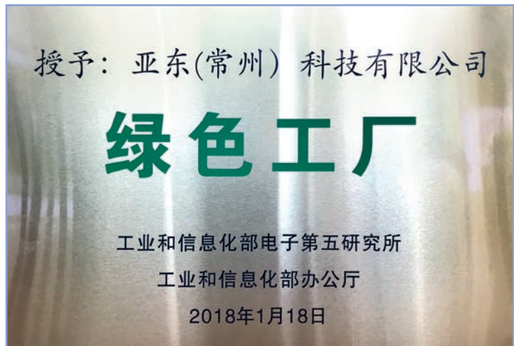
亞東常州國家級綠色工廠標牌