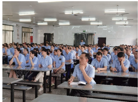
化學品員工培訓活動