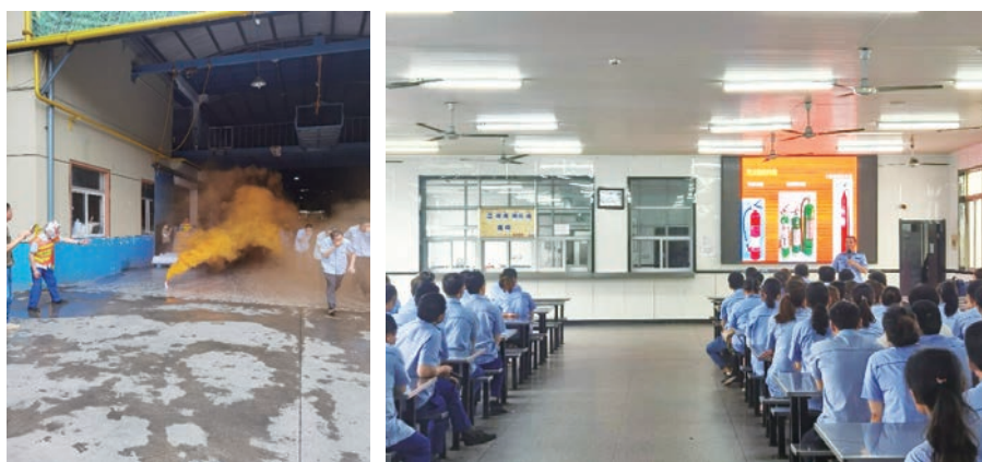
亞東常州開展消防應急演練活動

本集團組織開展了各類安全教育培訓活動，包括綜合應急預案演練、車間火災現場處置方案演練、觸電事故現場處置方案演練和機械傷害現場處置方案演練，通過一系列演練活動有效增強員工們應對突發事件的能力，提高整體安全意識。本報告期內，亞東常州在職業健康與安全方面投入的資金約為190萬元，共有482人次參加了本年度的相關培訓活動，每名員工的平均培訓時長為12小時，健康安全培訓總時長為5,784小時。