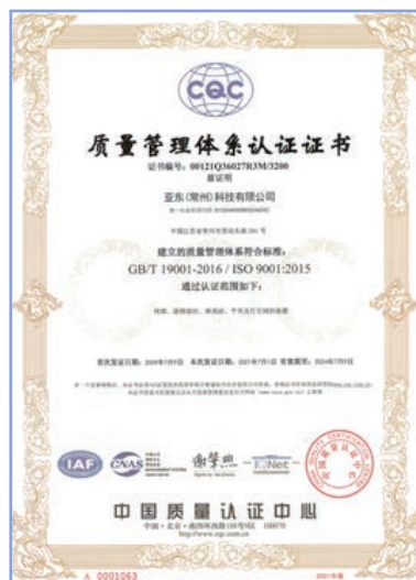
亞東常州質量管理體系認證證書

本集團堅信好的坯布是染廠保證產品質量的前提，因此工廠通過加強來坯的檢驗工作以踐行產品高標準生產。亞東常州要求在崗人員堅守「規範、標準、公開、透明」的八字方針，同時於內部制定《質量管理制度》並實施必要控制措施以嚴格管控進出廠的產品質量，從原料的採購、生產流程、生產工藝、到最終成品以及包裝的各個環節都進行了嚴密的設置和把控，並獲得了質量管理體系認證證書(GB/T 19001-2016以及ISO 9001: 2015)質量管理體系認證。