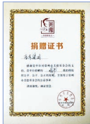
榮獲美德基金會證書