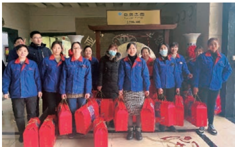
為員工發放過年大禮包