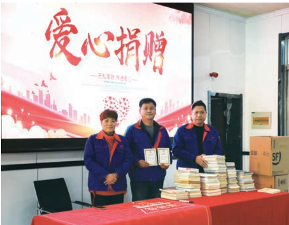
亞東常州舉辦愛心捐書活動

為提升員工的社會責任感，號召更多的員工參與志願活動，關注兒童教育成長，本集團組織員工舉辦愛心捐書公益活動，在中國郵政的協助下運送書籍，為貧困山區的孩子送去精神食糧，充實豐富孩子們的生活，捐贈了價值3,000餘元的書籍。同時，為山區居民提供便民服務，如協助換駕照、代繳水電煤氣費、代發養老金等。